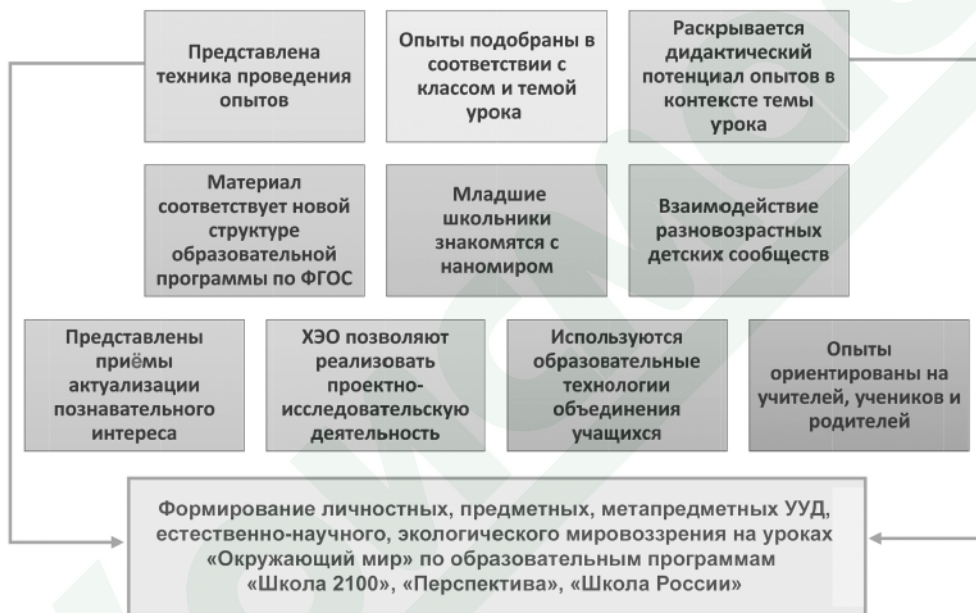
Рисунок 1. Система реализуемых направлений в проведении предлагаемого демонстрационного химического эксперимента

Содержание настоящего учебно-методического пособия и выполнение соответствующих опытов с активным включением учеников в экспериментальную деятельность обогащают образовательную среду школы через обновление содержания школьного обучения, в контексте современных требований ФГОС. Система реализуемых направлений в проведении предлагаемого демонстрационного химического эксперимента приведена на рис. 1.