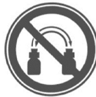
Запрещается менять пробки различных сосудов