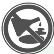
Запрещается оставлять неубранными вещества и реагенты