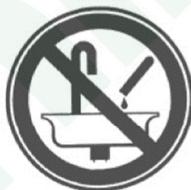
Запрещается сливать вещества в необорудованные ёмкости