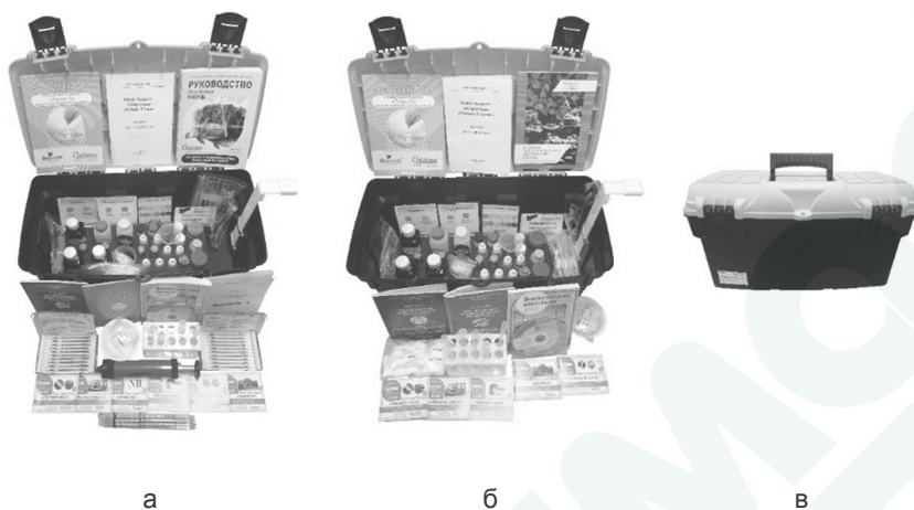
Рисунок 3. Мини-экспресс-лаборатории «Пчёлка-У»: а, б — изделия в модификациях «Пчёлка-У/хим» и «Пчёлка-У/почва», в — вид изделий в закрытом контейнере

же комплект тест-систем и принадлежностей для анализа воды и водных сред. Данное изделие мы также относим к оборудованию, полезному при организации и проведении химико-экологического практикума.