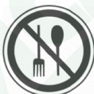
Запрещается пробовать вещества на вкус