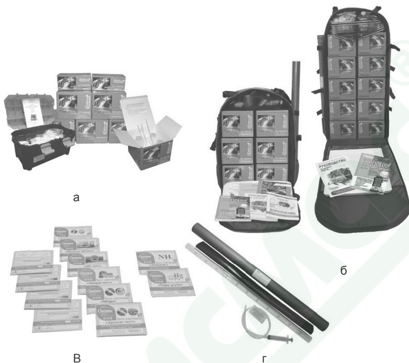
Рисунок 5. Внешний вид некоторых тест-комплектов и тест-систем для анализа воды: а — тест-комплекты различного типа; б — тест-комплекты в составе ранцевой полевой лаборатории модели НКВ-Р; в — тест-системы; г — тест-комплект «Прозрачность и мутность»

Благодаря эффективности и простоте применения, обеспеченности иллюстрированной инструкцией, руководствами и пособиями многие тест-комплекты широко применяются также в сфере образования при выполнении разнообразных практик, лабораторных работ, учебно-научных исследовательских и проектных работ. Тест-комплекты автономны, не требуют источников водоснабжения и электроснабжения.