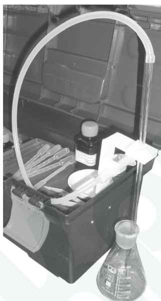
Рисунок 4. Принадлежности для количественного гидрохимического анализа из состава мини-лаборатории «Пчёлка-У/хим»

Методы количественного гидрохимического анализа воды и водных почвенных вытяжек с помощью аналитических реагентов, растворов и принадлежностей основаны на химических реакциях определяемых компонентов в воде (водной вытяжке) с реагентами, содержащимися в аналитических растворах из состава мини-экспресс-лаборатории «Пчёлка-У/хим» (рис. 4). Готовые аналитические растворы имеют специально подобранный химический состав, а их добавление к анализируемой пробе проводится с использованием мерной химической посуды (полимерной либо стеклянной). Анализ водных растворов и вытяжек выполняется полевыми методами, позволяющими количественно определять химический состав пробы непосредственно у водного объекта, в полевых условиях.