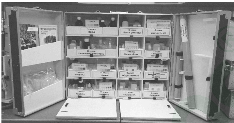
Рисунок 2. Секционные модули в общем виде укладки-лаборатории учителя ШХЭЛ Примечание. Производителем могут быть внесены отдельные изменения.