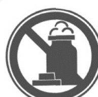
Запрещается оставлять реагенты открытыми